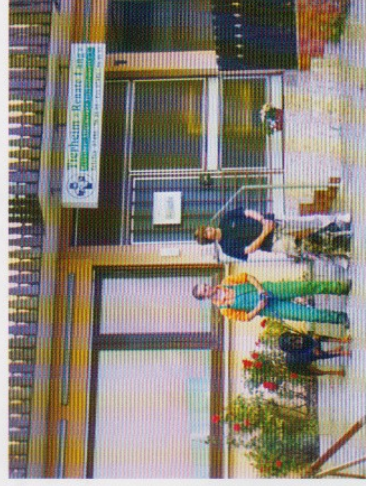
Eingangsbereich Tierheim „Renate Lang“