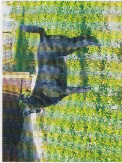
„Lady“ ist mit ihren 16 Jahren mit die Älteste im Tierheim.

Entstanden ist der „Allgemeiner Tierhilfsdienst e.V.“ aufgrund der Erfahrungen der Gründungsmitglieder - allesamt ehemalige Tierschutzmitarbeiter aus verschiedenen Organisationen - die nicht mehr bereit waren, die bisher üblichen Praktiken weiterzuverfolgen. Sie wollten andere Wege als die herkömmlichen Tierschutzvereine gehen. Hauptgrund der Unzufriedenheit war der Umgang mit alten Tieren, die durch ihre schlechten Vermittlungschancen oftmals immer noch getötet werden. Das sollte aufhören. Daher wurde im Juni 1989 der „Allgemeine Tierhilfsdienst e.V.“ gegründet.